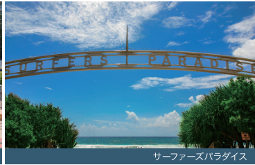
サーファーズパラダイス