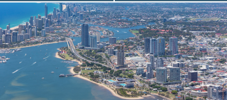
ホテルがあるサウスポートと背景に広がるゴールドコースト