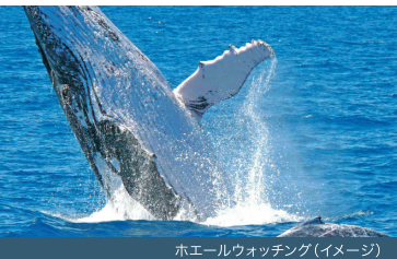
ホエールウォッチング(イメージ)

その他(近隣) オーストラリア・フェア・ショッピング・センター、 チャイナ・タウン、ハーバータウン・アウトレット