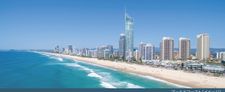
ゴールドコースト(イメージ)