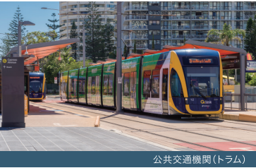
公共交通機関(トラム)