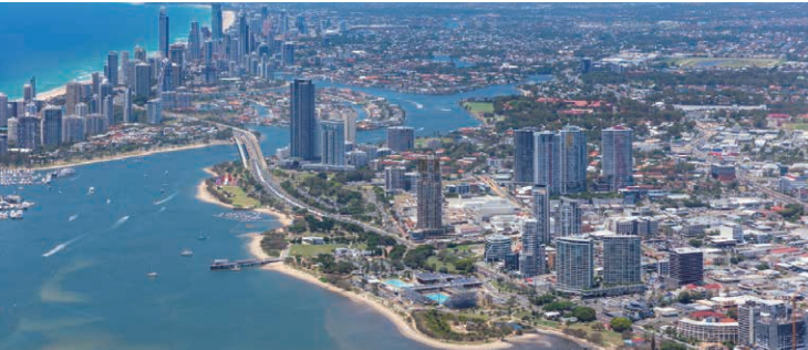
酒店所在的绍斯波特和背景中的黄金海岸